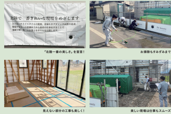
見えない部分の工事も美しく！

ことが目標です。地域の皆さまに支持され続ける企業であるために、家元の家づくりを支えてくれる職人さんと協力業者の皆さまとこれからも思いをひとつにし、どこよりも安全で美しい建築現場をめざしています。私たちの成長をぜひ見守ってください！