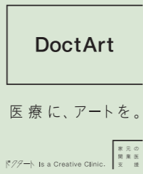
DoctArt Is a Creative Clinic.

今、アートの力で医療を変えようという取り組みが世界中で広まり、感度の高いドクターの間では常識になりつつあります。家元では4月より開業医支援事業として、「医療に、アートを」をコンセプトとした「DoctArt」(ドクター)をスタート。家元がプロデューサーとなり、医療経営コンサルタントや医療メーカー、法務、税務、人事、マーケティング、ブランディング、そしてアートの専門家と連携してサポートをするプロジェクトです。「Doct Art」が医院のブランディングをトータルに行い、経営面でも良いパートナーになります。