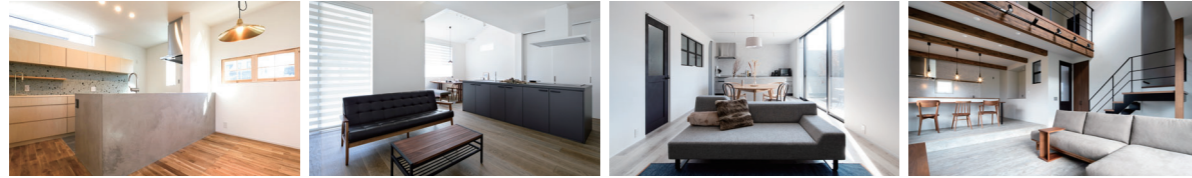
心ときめくオリジナルの家 昼夜で異なる顔を見せるアイランドキッチンのある家 壁に囲われたプライベートテラスと螺旋階段のある家 大人インダストリアルスタイルの家