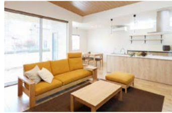
大人になってもかわいさを忘れない家