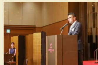
家元パワーアップ宣言!