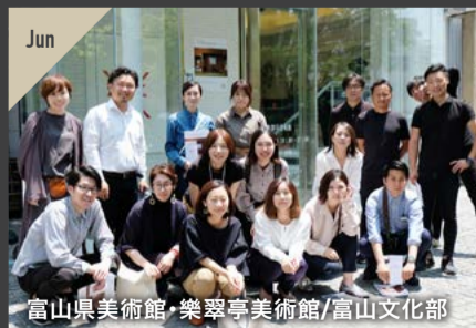
富山県美術館・樂翠亭美術館/富山文化部

観光ボランティアガイド「まいどさん」の案内で金沢城を見学。「石垣の博物館」とも称される多種多様な石垣や、釘を一切使用しない木造軸組工法など、職人の卓越した技と知恵に目を見張りました。