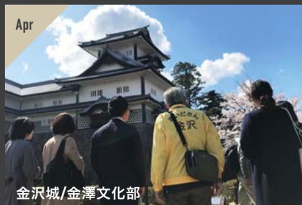
金沢城/金澤文化部

職人と家をつくるからには、街の文化や歴史を学ばなければならない。この想いからスタートした家元の社会活動が「金澤文化部」「富山文化部」です。