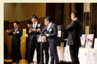
豪華景品も飛び出した抽選会