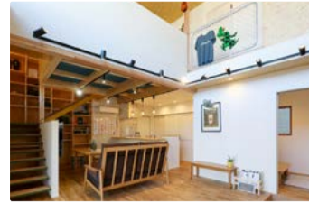
遊び心あふれるアウトドアな家