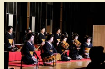
会場全体が聞き入った金沢素囃子