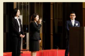
新入社員挨拶。ドキドキでした!