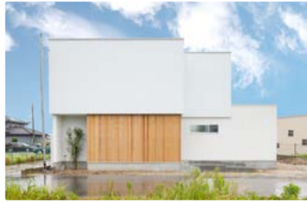
田園風景と異素材を組み合わせた家