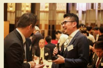
談笑する社長。感慨もひとしお