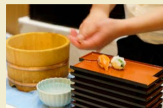
握りたてのお寿司、おいしかったです!