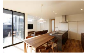
こだわりのキッチンカウンターのある家