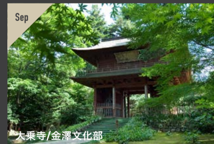
大乘寺/金澤文化部

アート・デザインと日本建築・庭園という、趣が異なる美術館を一日で回りました。もちろん作品鑑賞も楽しみましたが、つつい建物そのものに目が行ってしまう家元スタッフ一行でした。